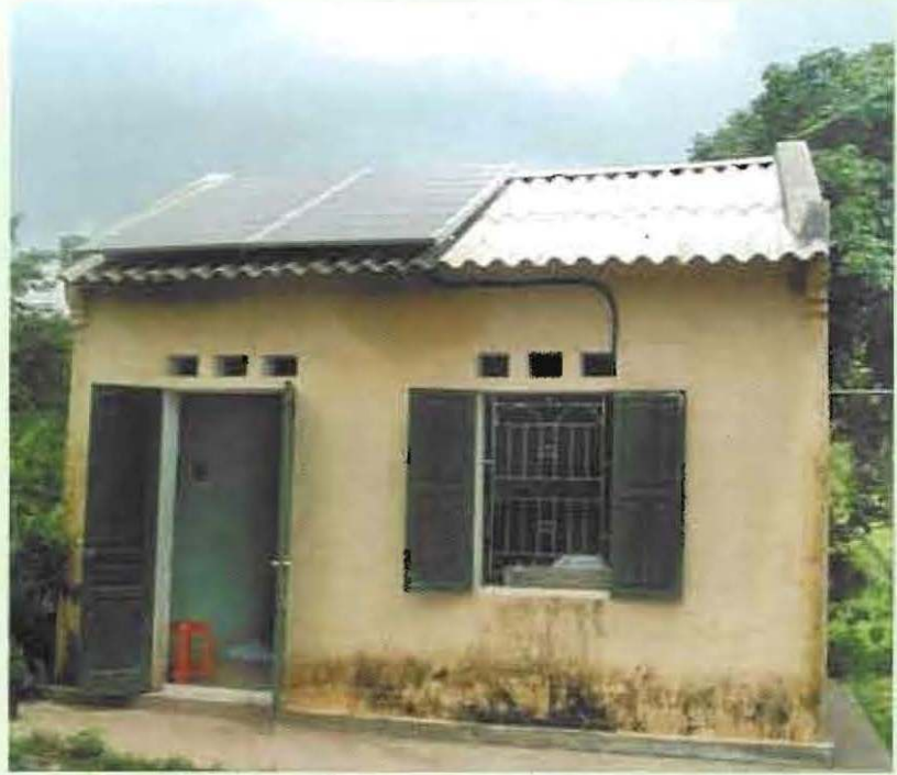
ផ្ទះអញ្ចាញ់ថាមពលពន្លឺព្រះអាទិត្យ ដែលតំឡើងលើកំបូលថ្មនៅជនបទ

កម្មវិធីខាងលើផ្តល់នូវមូលនិធិក្នុងការជំរុញការប្រើប្រាស់ថាមពលកកើតឡើងវិញប្រសិទ្ធភាពថាមពល និងបច្ចេកវិទ្យាថាមពលស្អាតផ្សេងៗ។ គោលបំណងរបស់កម្មវិធីនេះគឺប្រយុទ្ធប្រឆាំង នឹងបំប្លែងអាកាសធាតុដោយផ្តល់នូវសេវាកម្មថាមពលប្រកបដោយចីរភាពដល់អ្នកត្រូវការថាមពល។